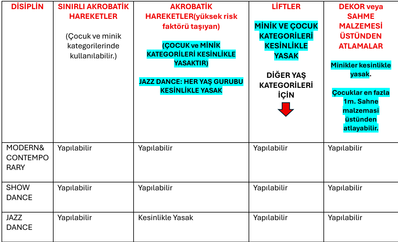
Tablo - F